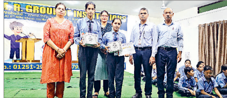
झज्जर। विजेता प्रतियोगियों को पुरस्कृत करते हुए शिक्षक।