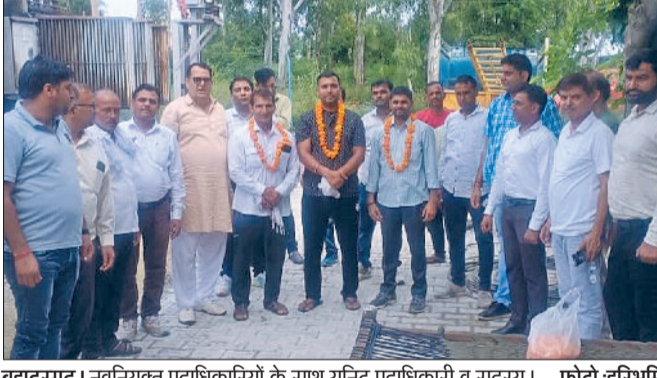
बहादुरगढ़। नवनियुक्त पदाधिकारियों के साथ यूनिट पदाधिकारी व सदस्य।