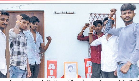
बहादुरगढ़। खुदीराम बोस को श्रद्धांजलि देते एआईडीएसओ कार्यकर्ता।