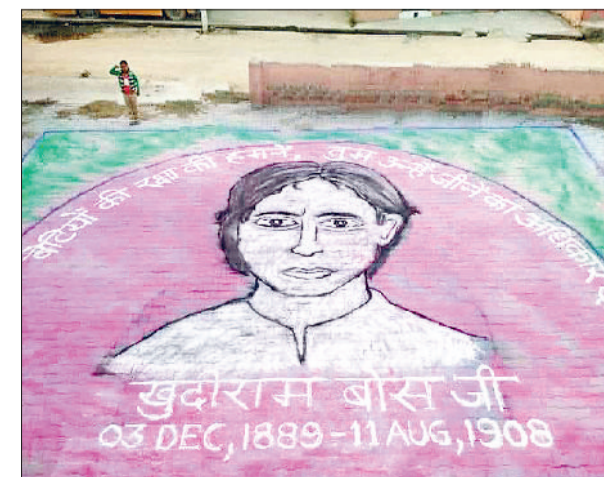
झज्जर। भदना गांव की चौपाल में बनाया गया विशाल रेखाचित्र।