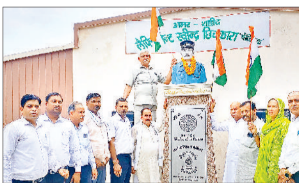
सम्मानित किया जाएगा उसके बाद तिरंगा यात्रा निकाली जाएगी जो सिलानी गेट के राव तुलाराम चौक, अंबेडकर चौक, छिक्कारा चौक