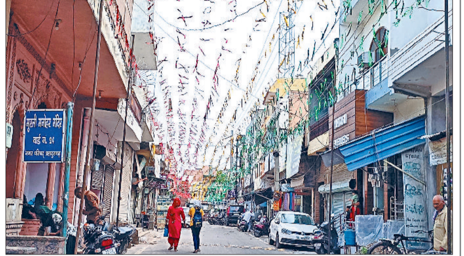
बहादुरगढ़। मुरली मनोहर मंदिर के बाहर लगाई गई लड़ियां।