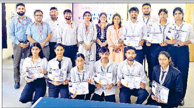
झज्जर। शिक्षकों के साथ उपस्थित प्रतिभागी विद्यार्थी।