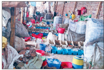
बहादुरगढ़। संयुक्त टीम के निरीक्षण के दौरान निजामपुर रोड पर पकड़ी गई अवैध इकाइयां।

राज्य प्रदूषण नियंत्रण बोर्ड, नगर परिषद, सिंचाई विभाग, पंचायती राज, उत्तरी हरियाणा बिजली वितरण निगम, पब्लिक हेल्थ विभाग और पुलिस के प्रतिनिधियों की संयुक्त टीम ने सोमवार को निजामपुर रोड पर दस्तक दी।