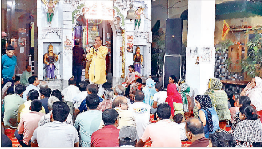
झज्जर। संकीर्तन में भजनों की प्रस्तुति देते हुए गायक कलाकार।